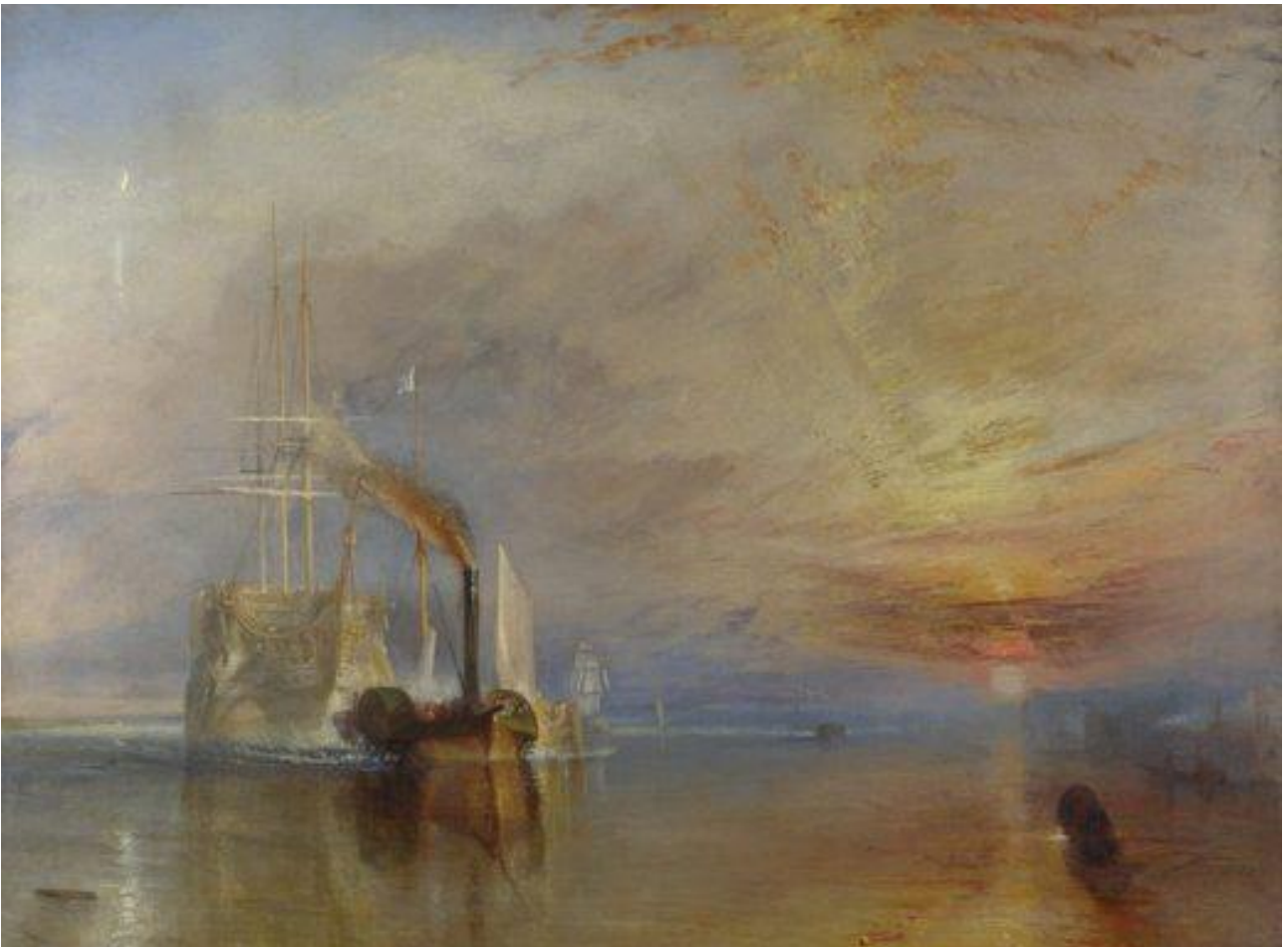
« Le Téméraire » de W. Turner

Petites Merveilles Étonnement terrible Devant tant Beauté sous les yeux Disparitions de nos trésors Si laborieusement constitués Richesse aléatoire Constance Sans cesse Réactualisée Boussole hésitante Aiguille reniflant Le juste alignement Nouvelle déclinaison magnétique