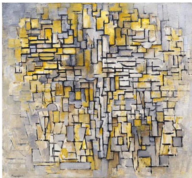
« Tableau No 2/composition No VII » de P. Mondrian