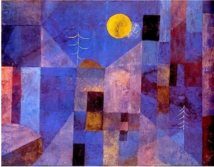
« Moonshine » de P. Klee