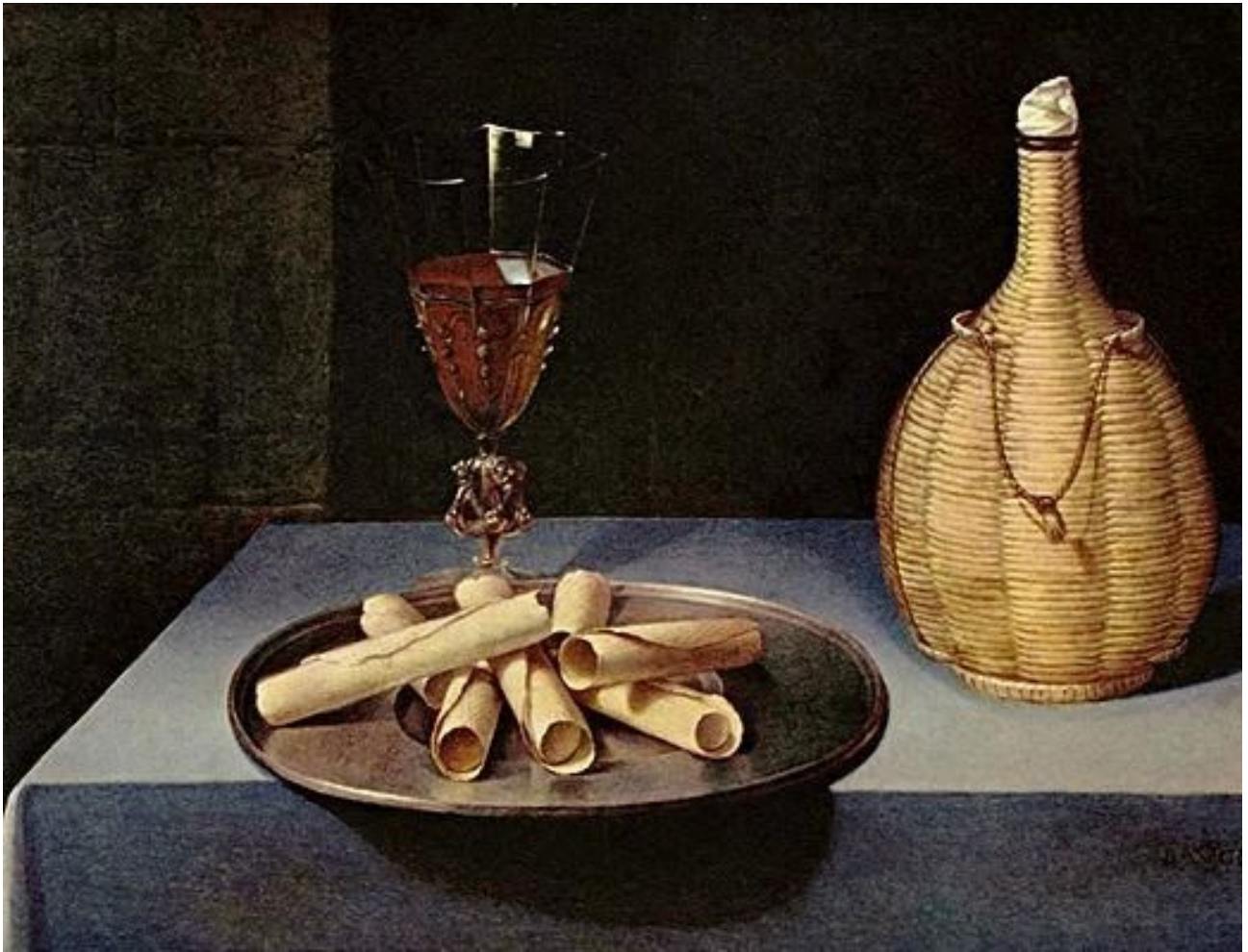
« Le Dessert de gauffrettes » de L. Baugin