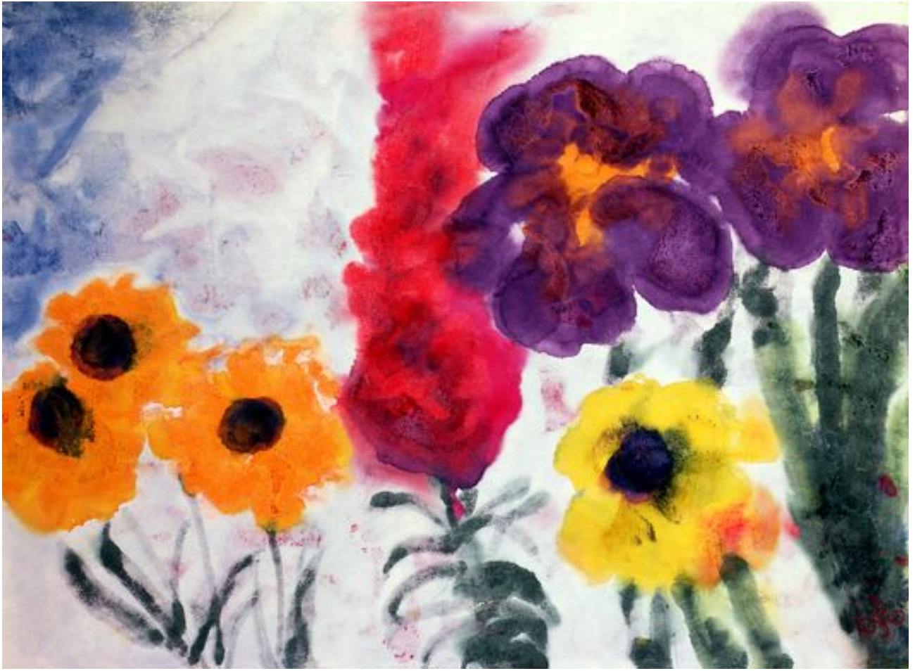
« Les fleurs du jardin » de E. Nolde