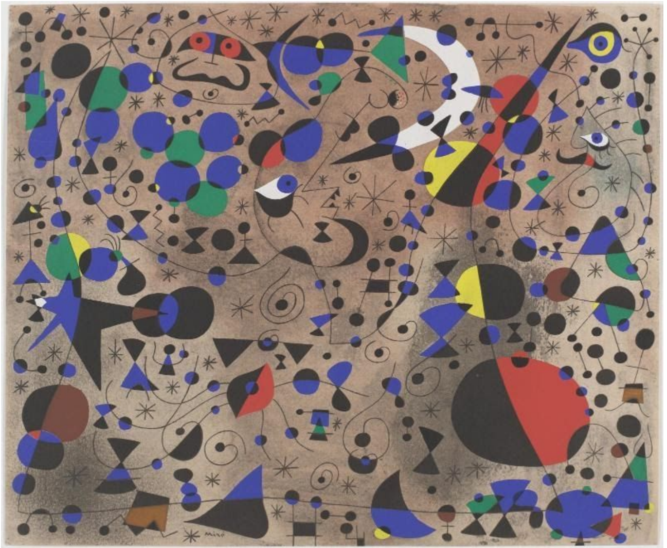
« La Poétesse » de J. Miró