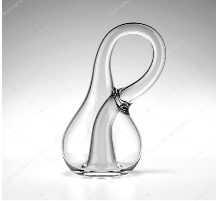
Bouteille de Klein